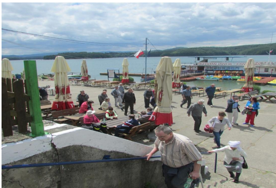
pohľad na jazero...