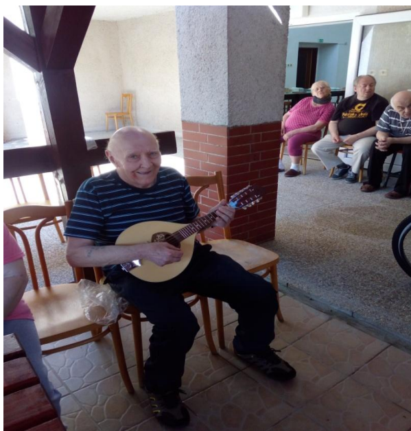
p. Hnatik balalajka.