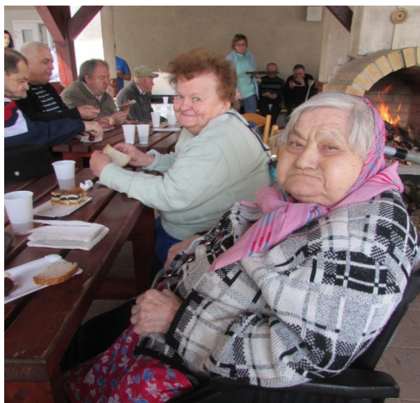
... opekačka v altánku ...