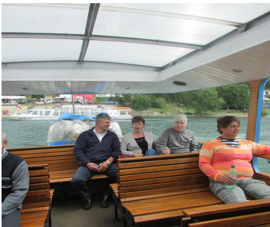
plavba loďou ...