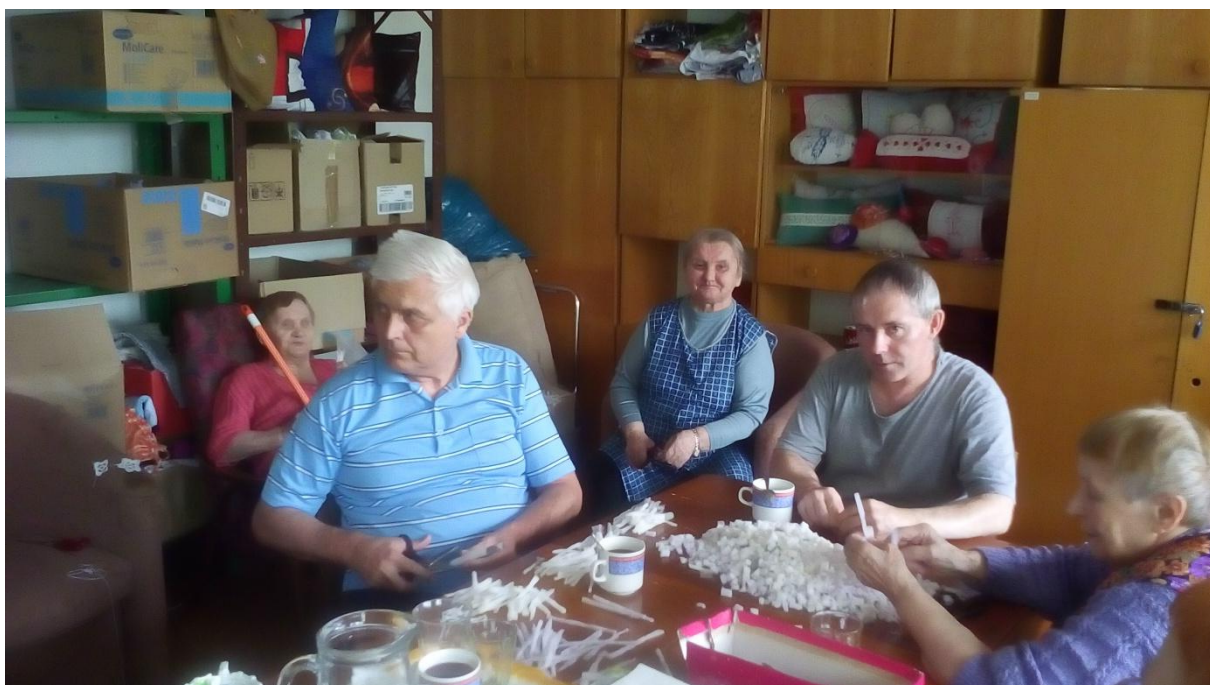
Klub ručných prác: strihanie molitanu, výroba vankúšov, kobercov, štrikovanie.